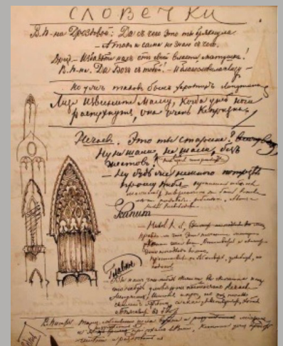
Ф.М. ДОСТОЕВСКИЙ (1821-1881)

ΟΔΗΓΟΣ ΣΠΟΥΔΩΝ ΑΚΑΔΗΜΑΪΚΟΥ ΕΤΟΥΣ 2021-2022